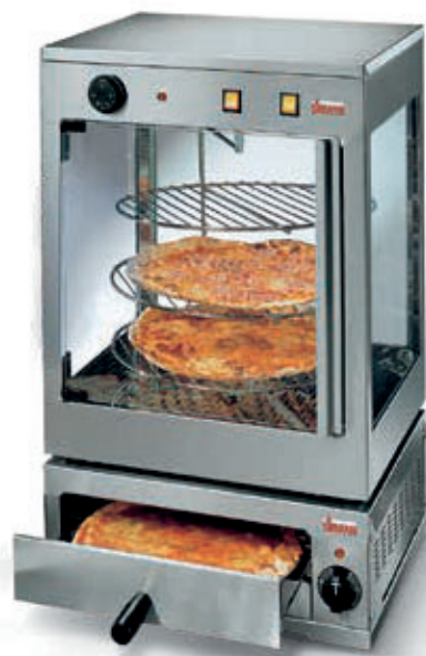
Forno pizza impilabile con la vetrinetta D.38 Stacking Pizza oven with Vetrinetta D. 38